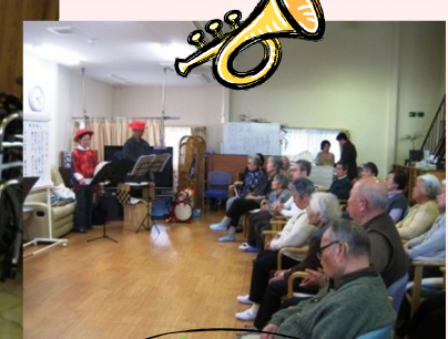
お客様も演奏に参加されました