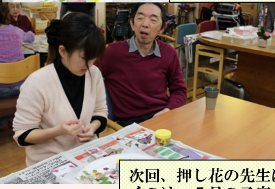
次回、押し花の先生にお越しいた くのは、5月の予定です