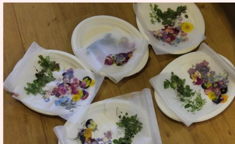
たくさんの花があります