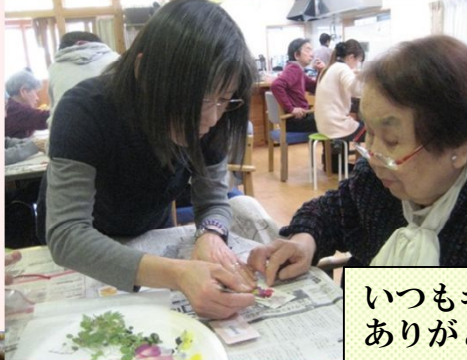
いつもキレイな花をご用意して下さい、 ありがとうございます☆