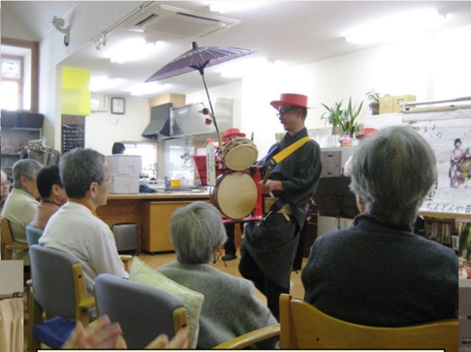
賑やかな演奏とともに登場です！