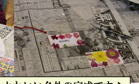
かわいい名札の完成です♪