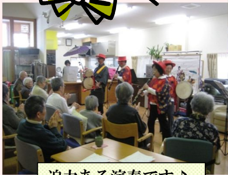
迫力ある演奏です♪