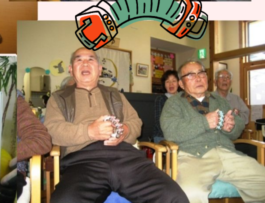
次回お越し頂けるのを、楽しみにしています！