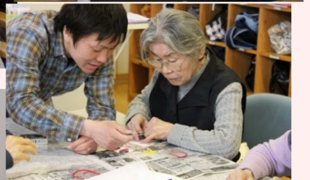
皆さん真剣な表情ですね！