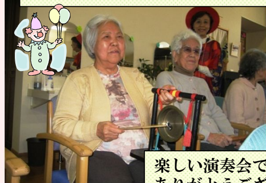
珍しい楽器で、自分で演奏をする事も楽しかったですね