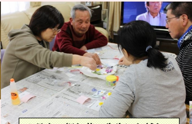
3月も、押し花の先生にお越し いただきました！